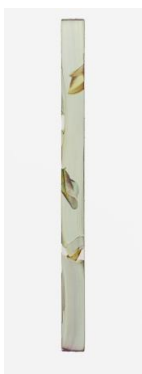
Markus Saile Pipe#38 2023 sygnowane i datowane na rewersie olej na drewnie 190 x 13 cm