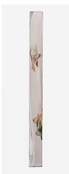
Markus Saile Pipe#37 2023 sygnowane i datowane na rewersie olej na drewnie 151 x 13 cm

Pipes Markusa Saile można oglądać od 13 grudnia 2024 do 28 lutego 2025, od środy do soboty w godzinach 11—16, ul. Święty Marcin 49a, Poznań. W celu uzyskania dodatkowych informacji prosimy o kontakt pod adresem: info@galeriaskala.com .