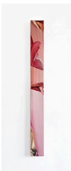
Markus Saile Pipe#48 2024 sygnowane i datowane na rewersie olej na drewnie 137 x 13 cm