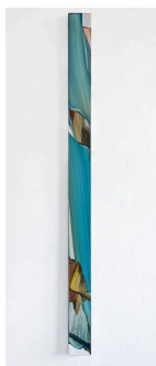
Markus Saile Pipe#46 2024 sygnowane i datowane na rewersie olej na drewnie 200 x 13 cm